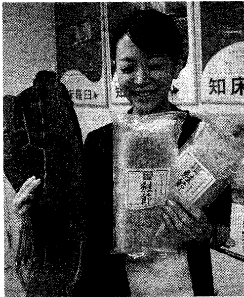
知床羅臼町観光協会事務局長